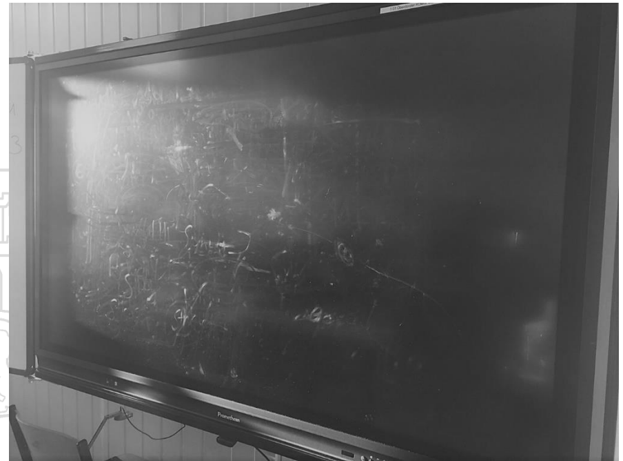
neues iaD, 1 Woche Nutzung